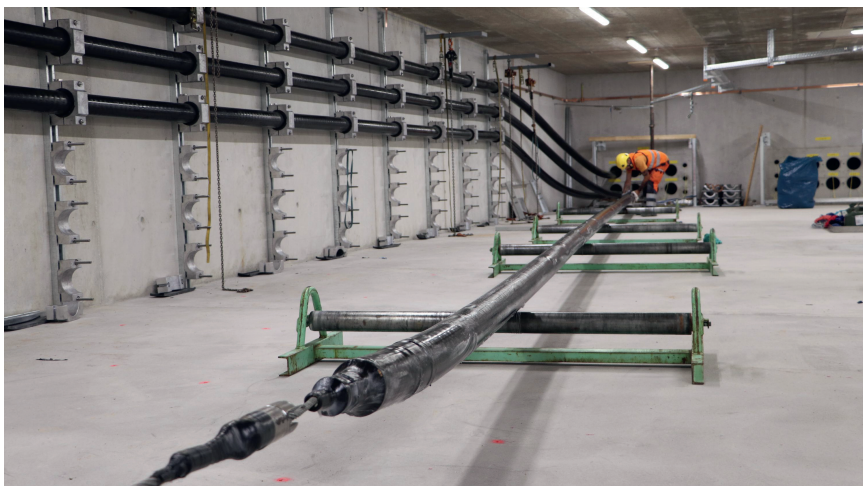
Bild 3 Die Verlegung eines Erdkabels.