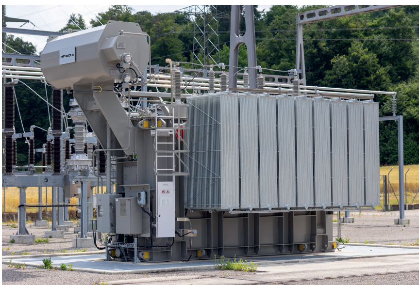
Bild 4 Ein Shunt Reactor (50 Mvar) zur Kompensation von Blindleistung.