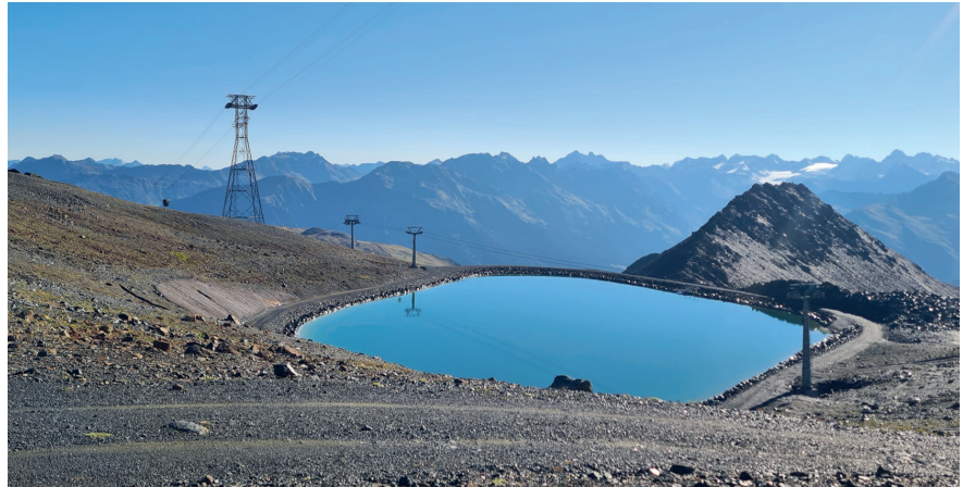
Der befüllte Totalsee ist bereit für die Beschneigung im nächsten Winter.

Die Lösung basiert auf einem prognosegestützten Fahrplanverfahren: Der Energielieferant stellt täglich um 9.00 Uhr eine Sieben-Tage-Prognose der Spotpreise zur Verfügung. Basierend auf dieser Prognose legt der zuständige Schneimeister einen maximalen Preis fest, zu dem gepumpt werden darf. Liegt der prognostizierte Preis darunter, wird ein entsprechendes Fahrprofil erstellt und um 9.30 Uhr an den Energielieferanten übermittelt, damit die entsprechende Energiemenge bereitgestellt werden kann. Die Steuerung folgt am Folgetag ab Mitternacht exakt diesem Profil.