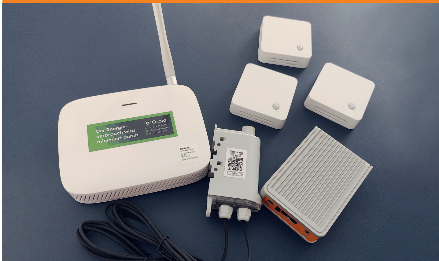
Die Plattform: LoRa-Infrastruktur, Gateways und Optimierungsplattform.