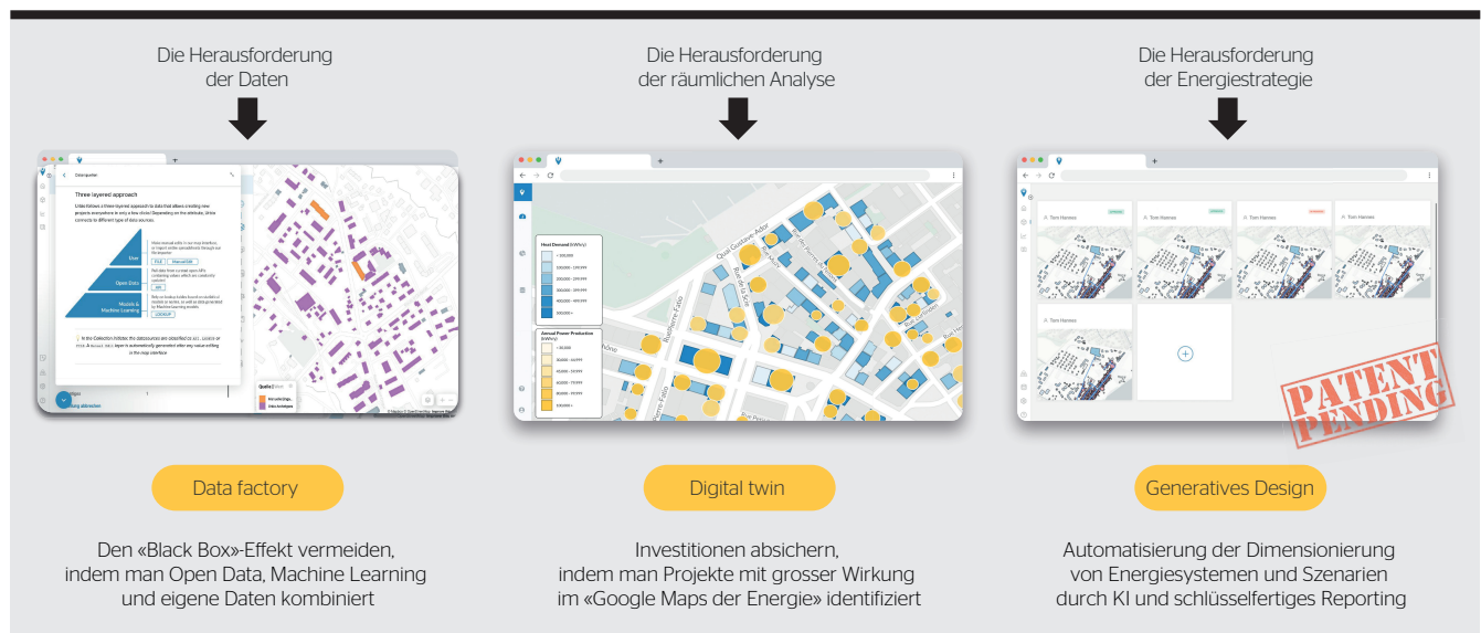
Bild 1 Die drei Säulen der 3-in-1-Software von Urbio.

Automatisierung der Dimensionierung von Energiesystemen und Szenarien durch KI und schlüsselfertiges Reporting