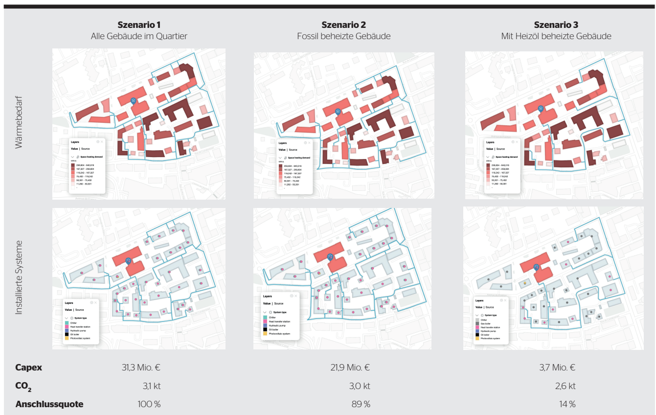
Bild 3 Drei alternative Szenarien für Wärmenetze, erstellt mit KI. Die Daten sind zur Wahrung der Vertraulichkeit indikativ.

Mit generativem Design können Akteure im Energiebereich grössere Gebiete viel schneller als bisher untersuchen. Und mit besseren Ergebnissen, da verschiedene Optionen mit geringerem Aufwand verglichen werden können, wodurch sich die Investitionsrendite erhöht. Das Ergebnis ist, dass Ingenieure und Vertriebsteam mehr Zeit damit verbringen, den Kunden einen Mehrwert zu bieten, als Daten und Szenarien vorzubereiten.