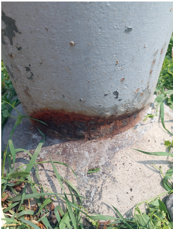
Eine Mastprüfung gibt Auskunft darüber, ob Korrosion die Standsicherheit beeinträchtigt.

regelmässigen Sichtprüfungen der Beleuchtungsmasten. LEDs zeichnen sich durch eine längere Lebensdauer aus und müssen deutlich seltener ausgetauscht werden als herkömmliche Leuchtmittel. Früher wurden während dieser Lampenwechsel die Masten routinemässig auf strukturelle Integrität und mögliche Schäden hin überprüft. Gemäss der ESTI Weisung 244 können die Prüfintervalle auf bis zu fünf Jahre ausgedehnt werden. Obwohl diese verlängerten Intervalle auf den ersten Blick