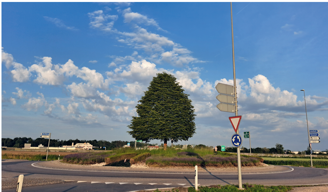
Kandelaber werden oft für das Anbringen von Strassenschildern benutzt.