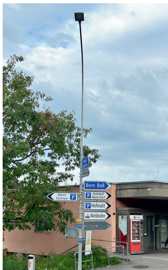
Die zusätzliche Windlast durch Verkehrsschilder ist erheblich; eine Windlastberechnung ist daher Pflicht.

che und extreme Belastungen dar, die das Risiko eines Mastversagens erhöhen. Es ist daher entscheidend, die Windlastberechnung regelmässig anzupassen und dabei alle angebrachten Elemente zu berücksichtigen.