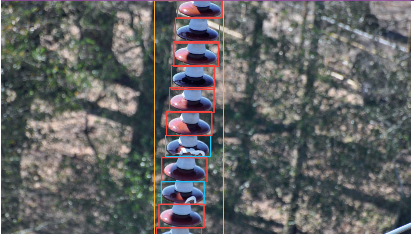
Photo d'un isolateur, prise par un drone puis analysée. Les disques défectueux sont encadrés en bleu.