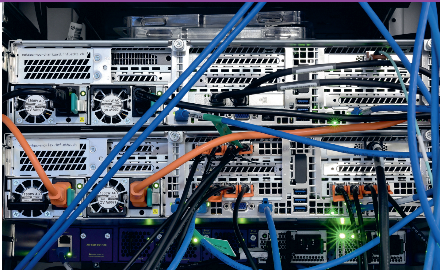
Mit dem Scion-Netz der ETH Zürich verbundene Endanwendungs-Server.