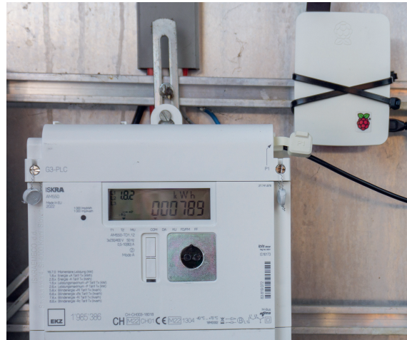
Installation vor Ort - über WLAN oder Ethernet kann auf das Toolkit zugegriffen werden.

In der Initialisierungsphase des Projekts wurde evaluiert, ob die definitive Lösung über eine eigene Hardware auf Basis eines Microcontrollers und der entsprechenden M-Bus- oder DMSR-P1-Schnittstelle verfügen soll. Dies hätte jedoch entweder viel Aufwand für die Produktion und den Vertrieb