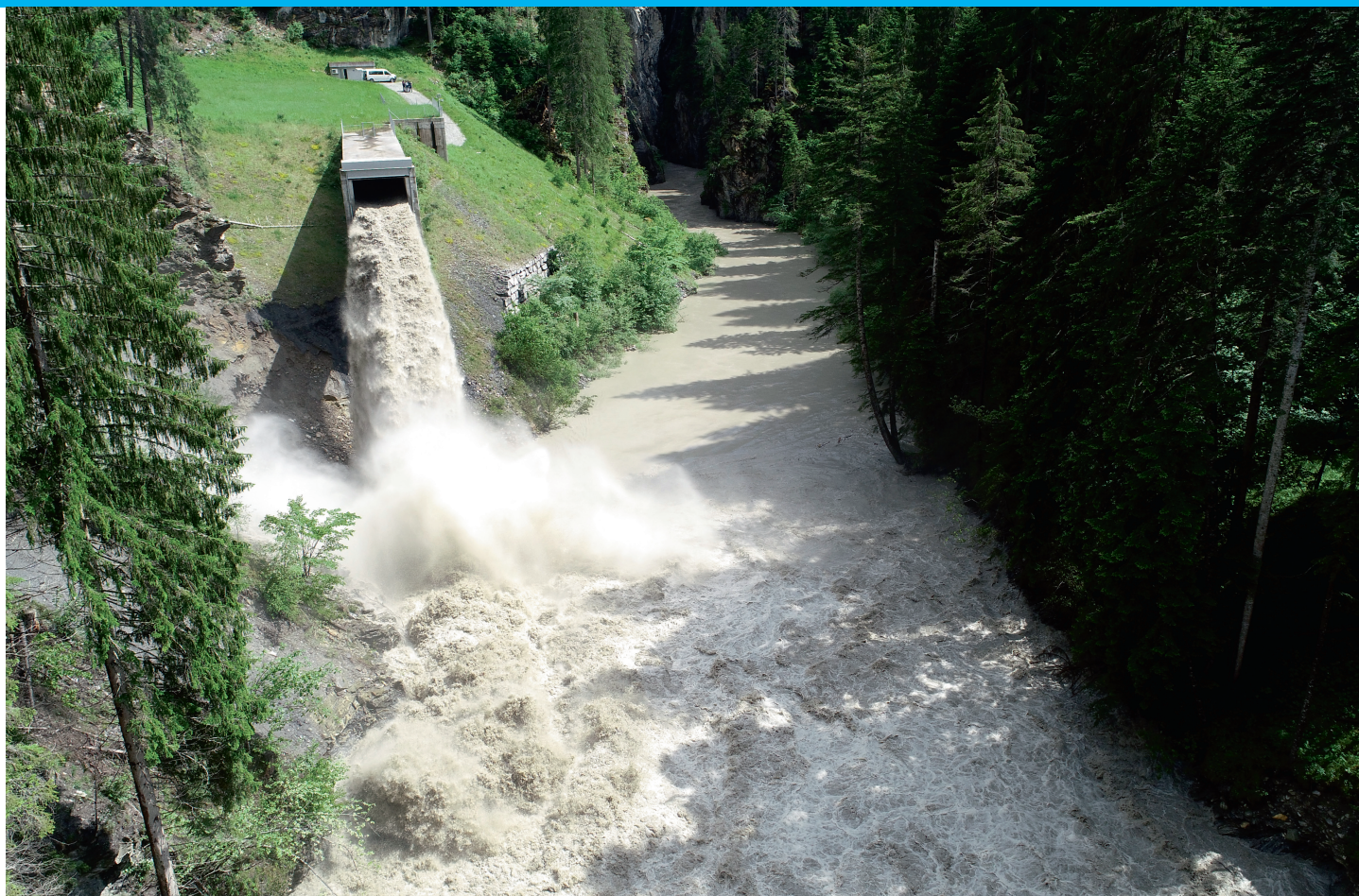
Les sédiments retournent dans l'Albula via la galerie de dérivation.