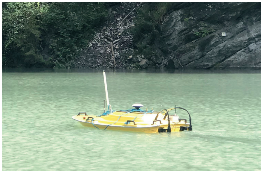
Bateau télécommandé équipé d'appareils de mesure, notamment pour la saisie de la hauteur du fond du lac de barrage et de la vitesse d'écoulement, utilisé par les chercheurs du VAW sur le lac de Solis.

sédiments fins (comme à Bolgenach, dans le Vorarlberg) n'est guère utilisée jusqu'à présent, mais pourrait constituer une option à l'avenir si les projets de recherche correspondants sont couronnés de succès.