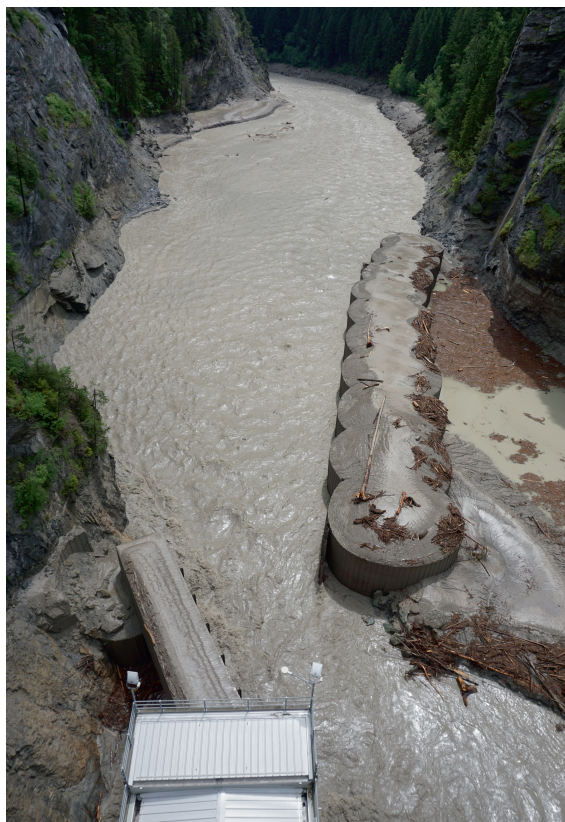
Entrée de la galerie de dérivation des sédiments (en bas à gauche, vue dans le sens inverse de l'écoulement de l'Albula).