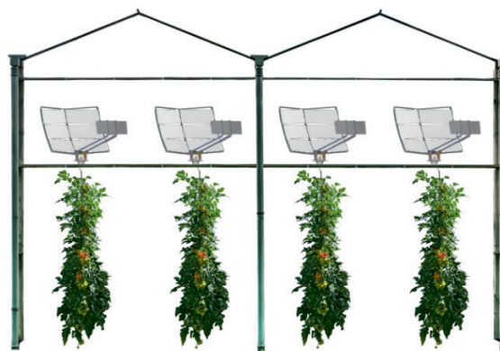
Figure 1 Schéma d'installation d'un système Voltiris X6 à six filtres par panneau solaire. Les réflecteurs se montent à l'intérieur de la serre, au-dessus des cultures.

L'étude agronomique a été effectuée sur plusieurs cycles de plantations au cours de l'année 2022. Résultat: aucune réduction du rendement agricole n'a été constatée pour les cultures du basilic, des tomates et des poivrons par rapport à une surface de référence sans filtre. De plus, l'étude agronomique effectuée avec les filtres de type 1, c'est-à-dire sans transmission de la partie verte du spectre (longueurs d'onde comprises entre 500 et 600 nm), a montré que celle-ci n'était pas indispensable à la photosynthèse des cultures testées.