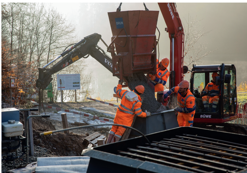
Bau der Mastfundamente beim Waldweiher.

Die Koordination der Ausschaltung stellt hier die grösste Herausforderung