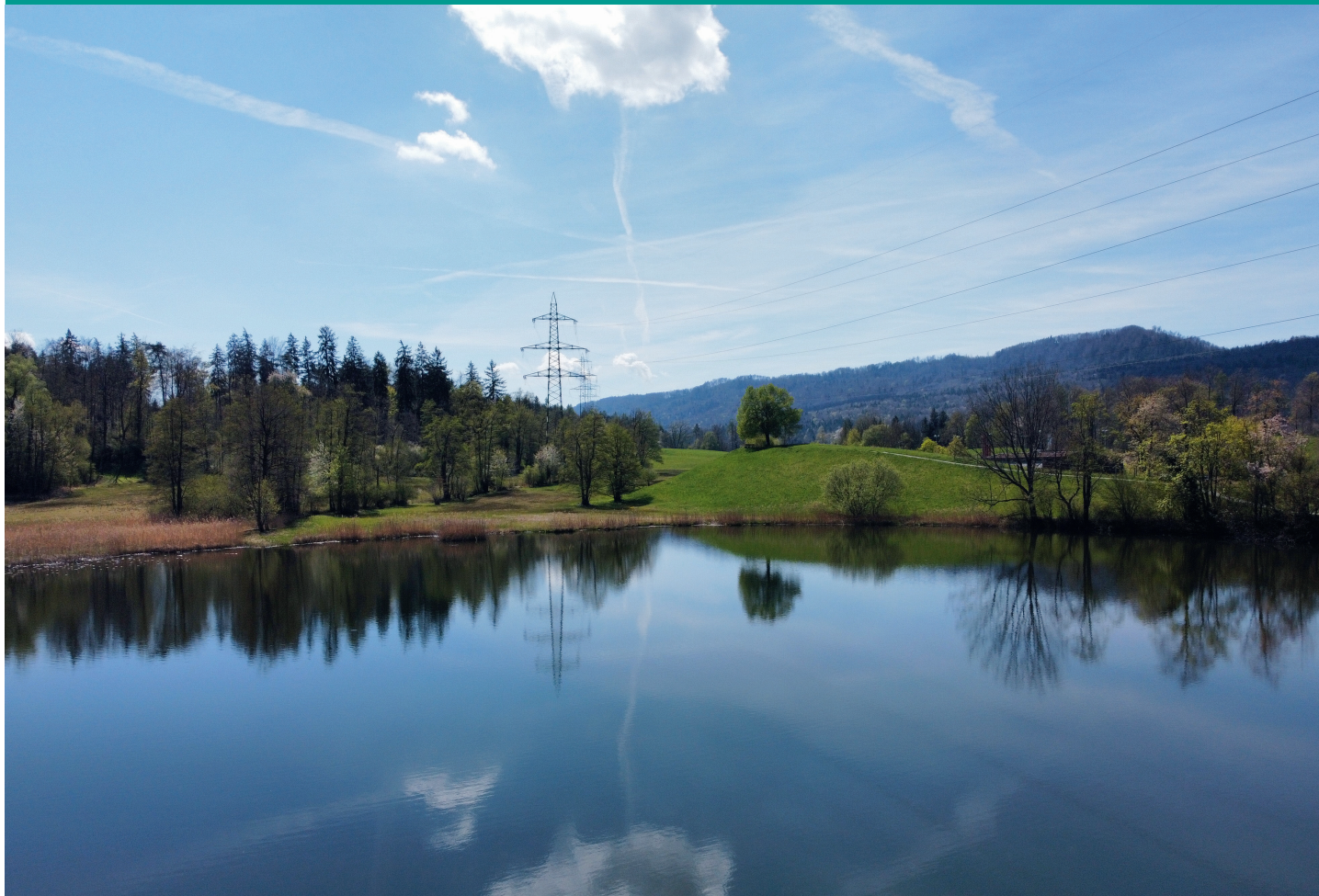
Bestehende 150-kV-Leitung beim Gattikerweiher (Gemeinde Thalwil).