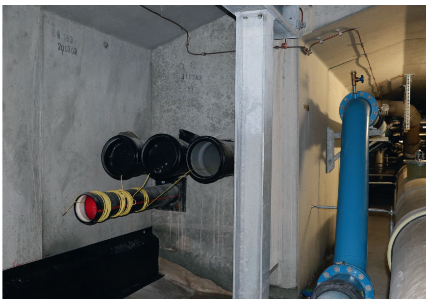
Die Kabel der neuen 220-kV-Leitungen verlaufen im Uetlibergtunnel unter der Fahrbahn. Sie werden in bereits erstellte Rohrblöcke neben dem Werkleitungskanal eingezogen.

dar, denn sie muss mit allen vier Partnern abgestimmt werden: