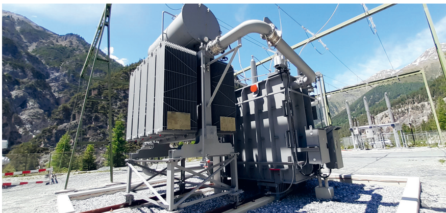
Bild 2 Variable Drosselspule mit AIS-Schalter im Betrieb (Ova Spin).

Im Blindleistungsregler werden die von Swissgrid viertelstündlich vorgegebenen Spannungswerte der 380-kV-Ebene ständig mit den aktuellen Istwerten der Sammelschienenspannung in Pradella verglichen. Ist der Istwert der Spannung zu hoch, muss mehr induktive Blindleistung von den Spulen erzeugt werden – der Stufenschalter fährt hoch.