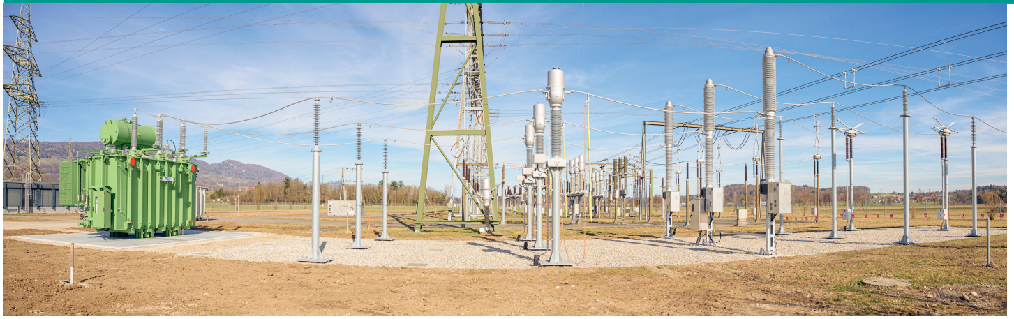
Installation mit Drosselspule, Kombiwandler und Leistungsschalter.