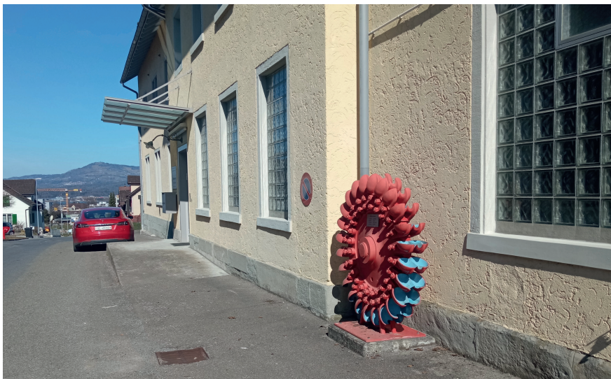
Figure 3 Située à proximité de la sortie d'autoroute de Lachen, dans le canton de Schwyz, la petite centrale de Spreitenbach a été retenue pour l'étude des modèles économiques dans le cadre du projet Small-Hydro Mobility.