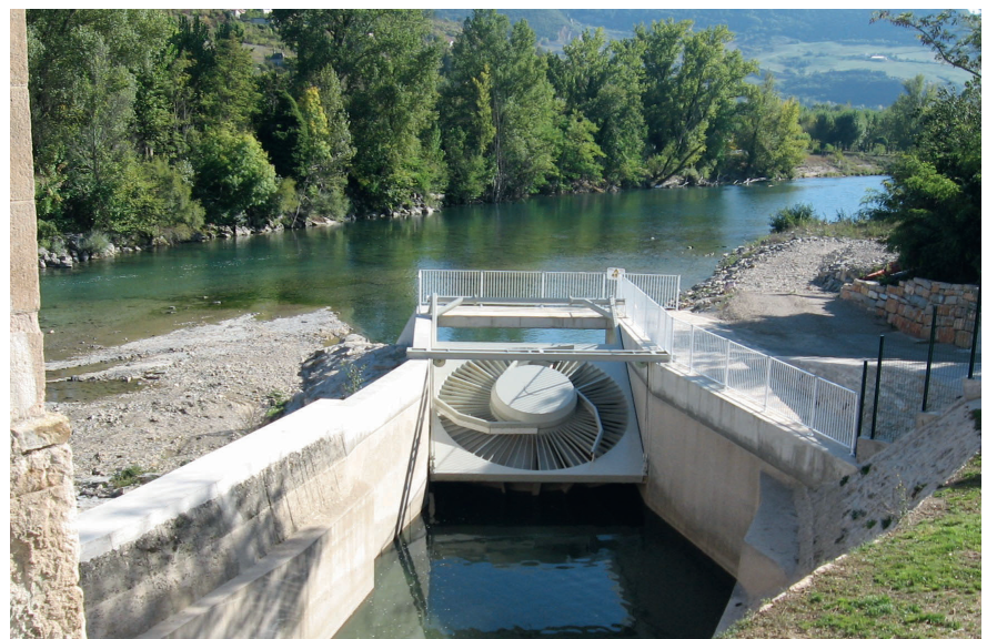
Figure 2 Exemple de turbine VLH en position levée.

doute face à l'avenir a été levé récemment. Depuis le 23.11.2022 [3], il est en effet établi que la CI s'applique depuis le 01.01.2023 aux nouvelles installations, avec toutefois une limite inférieure de puissance de 1 MW pour le turbinage des cours d'eau. C'est notamment cette limite inférieure que l'initiative populaire de Swiss Small Hydro demande de supprimer [4].