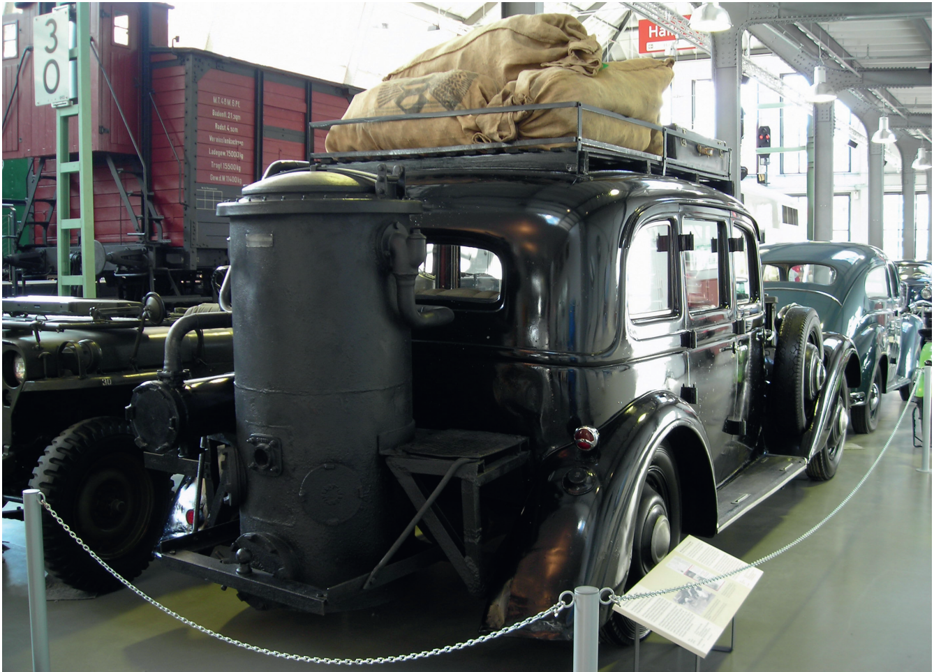
Adler Diplomat 3 GS mit Holzgasgenerator.