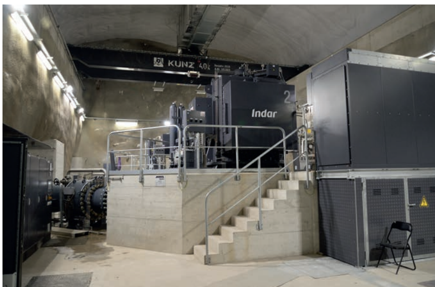
Kaverne bei Oberwald mit Kugelschieber (links) und Generator (oben).

Umwelt wurde allen Beteiligten klar, dass dies eine Chance ist. Man legte ein konsensfähiges Konzept fest, das vorsah, gleichzeitig mit dem Bau des Wasserkraftwerks die Situation der Rhone zu verbessern und die Gegend touristisch aufzuwerten. Der Fluss verlief nämlich früher in einem geraden, künstlichen Korsett – man wollte damals die Rhone «bändigen». Mit dem neuen, naturnahen Ansatz war die Akzeptanz nun gegeben.