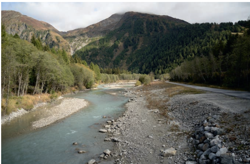
Die mit dem Bau des Wasserkraftwerks renaturierte obere Rhone.

tage der elektromechanischen und elektrischen Komponenten erforderlich war.