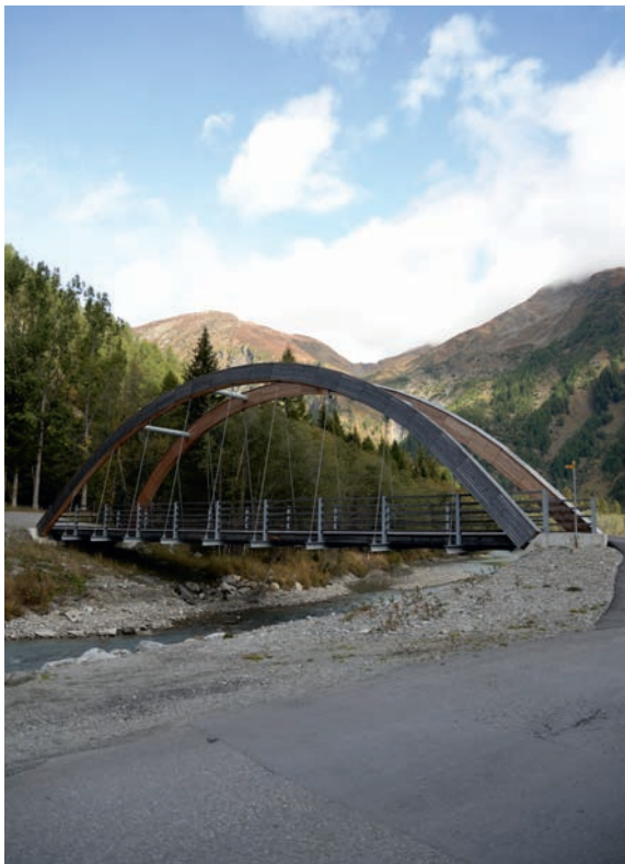
Die neue Brücke für Fussgänger war Bestandteil der Zusatzmassnahmen.