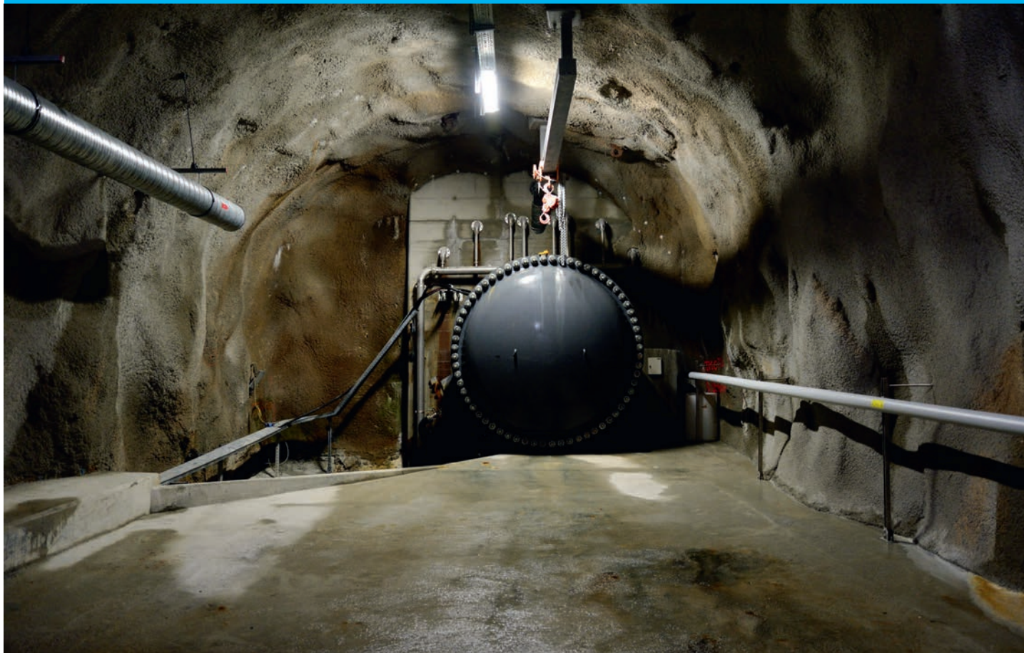
Das Ende des neuen Triebwasserstollens in Oberwald.