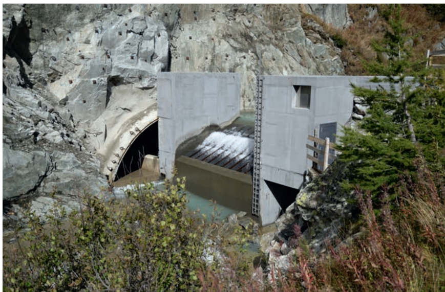
Fassung mit Eintritt in das Entsanderbecken unterhalb von Gletsch.

Aber auch im Wallis überlegt man sich, wo man neue Wasserkraftwerke erstellen kann. Die FMV SA plante den Bau eines Kraftwerks von Gletsch nach Oberwald. Zunächst stiess man auch hier auf Widerstände seitens der Umweltverbände, die sich noch bis 2010 massiv gegen den Bau des Wasserkraftwerks wehrten. Dann kam es zu einem Meinungsumschwung: Durch Diskussionen mit Vertretern aus dem Tourismusbereich, der Landwirtschaft, dem Verkehr und der