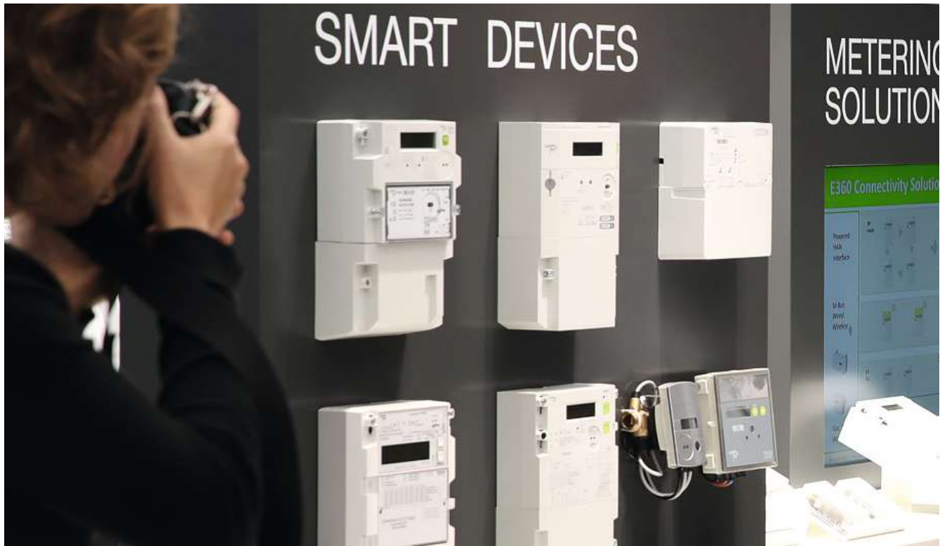
Moderne Smart Meter wie diese sollen schon bald zum Einsatz kommen.