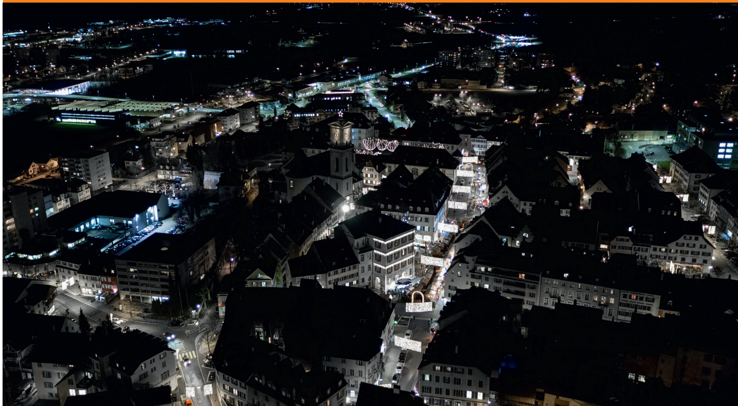
Delémont erstrahlt in neuem Licht.