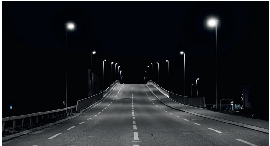
Bild 1 Neue Beleuchtung einer Hauptstrasse in Delémont.

Die importierten Daten werden in der kartenbasierten Software visualisiert. Durch die erfassten Geo-Koordinaten