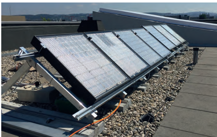
Figure 2 Installation pilote de modules Insolight à l'EPFL.

réduite. Les panneaux comportent plusieurs milliers de lentilles au mètre carré, et autant de minuscules cellules solaires positionnées à leur distance focale, qui au total recouvrent moins de 1% de la surface d'un module (figure 1).