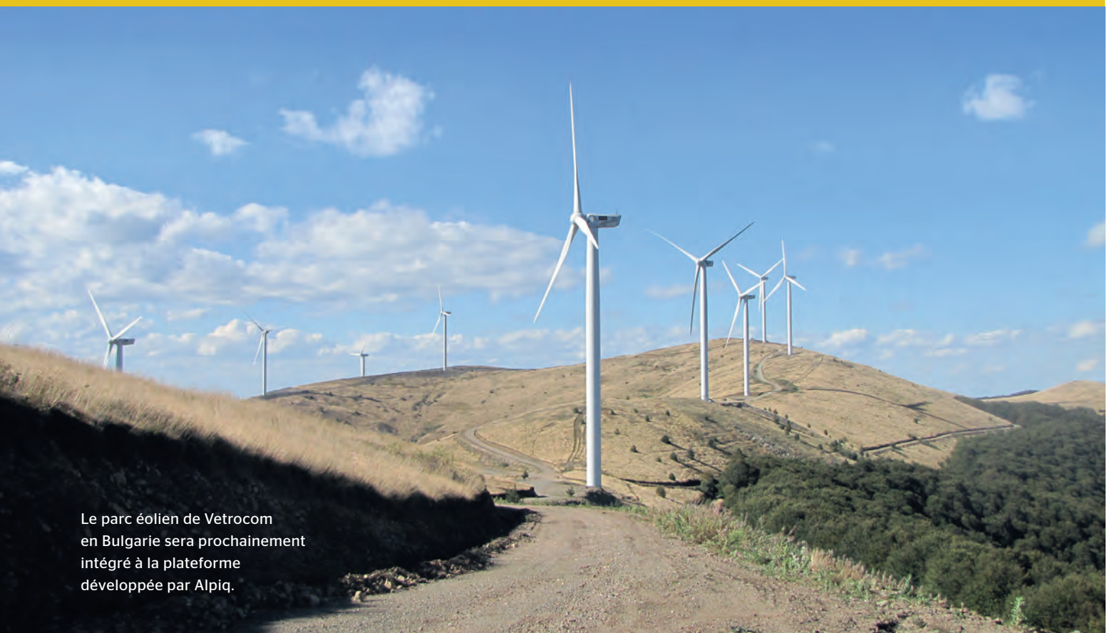
Le parc éolien de Vetrocom en Bulgarie sera prochainement intégré à la plateforme développée par Alpiq.