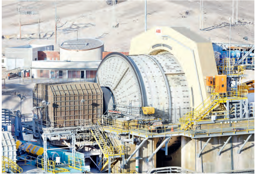
Un broyeur à minerai sans engrenage d'ABB: le CSEM utilise une telle installation dans le cadre d'un partenariat de recherche pour tester et développer sa solution de maintenance prédictive. Les algorithmes peuvent aussi être adaptés pour de petits systèmes.

De nombreuses approches de maintenance prédictive nécessitent d'innombrables capteurs supplémentaires qui, en raison de leur coût, vont renchéris