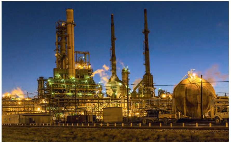
Dans de grandes installations telles que les raffineries, la défaillance d'une seule partie peut paralyser toute la production. Les lourdes conséquences financières justifient d'importants investissements dans la maintenance prédictive.

l'investissement de départ. De plus, chacun de ces capteurs représente une source potentielle d'erreur qui peut provoquer l'arrêt de la machine. Le CSEM suit une nouvelle voie en exploitant intelligemment les données de la machine, et ce, par le biais de réseaux de neurones artificiels.