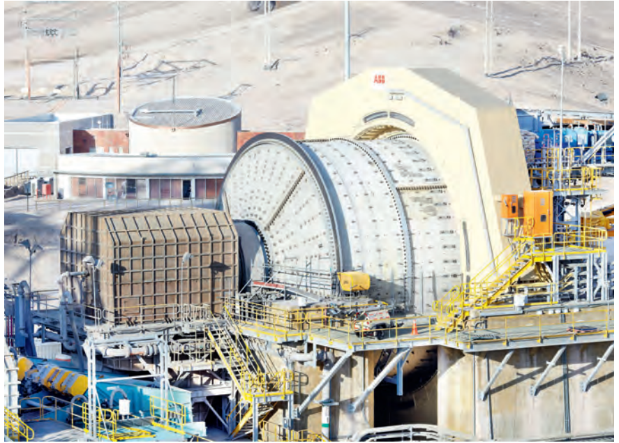
Eine getriebelose Erzmühle von ABB: Anhand einer solchen Anlage testet das CSEM im Rahmen einer Forschungszusammenarbeit die Predictive-Maintenance-Lösung und entwickelt sie weiter. Die Algorithmen lassen sich auch auf kleine Systeme übertragen.

In vielen aktuellen Predictive-Maintenance-Ansätzen werden unzählige zusätzliche Sensoren propagiert. Doch diese sind teuer und erhöhen den Installationsaufwand. Zudem ist jeder zusätzliche Sensor eine potenzielle Fehlerquelle, die zur Abschaltung der Maschine führen kann. Einen neuen Weg beschreitet das CSEM, nämlich die verfügbaren Maschinendaten intelligent zu nutzen. Den Schlüssel dazu bilden künstliche neuronale Netzwerke. Spätestens seit dem Durchbruch bei der Bilderkennung in autonomen Fahrzeugen und dem Sieg eines Computers gegen den amtierenden Welt-