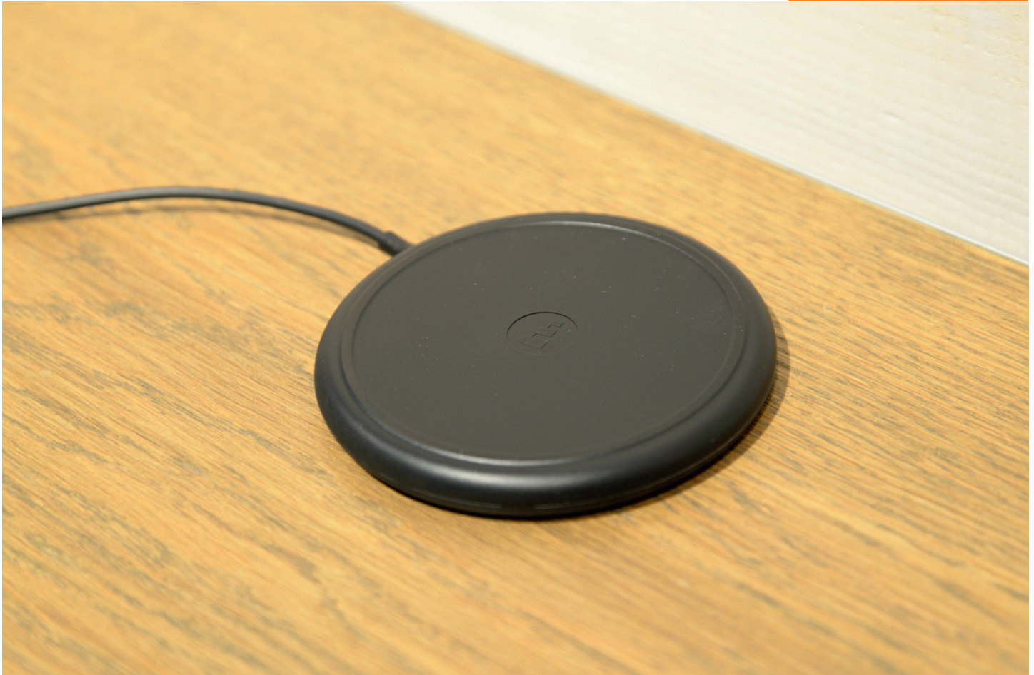
Das drahtlose Qi-Ladegerät von Mophie ist robust und schlank.