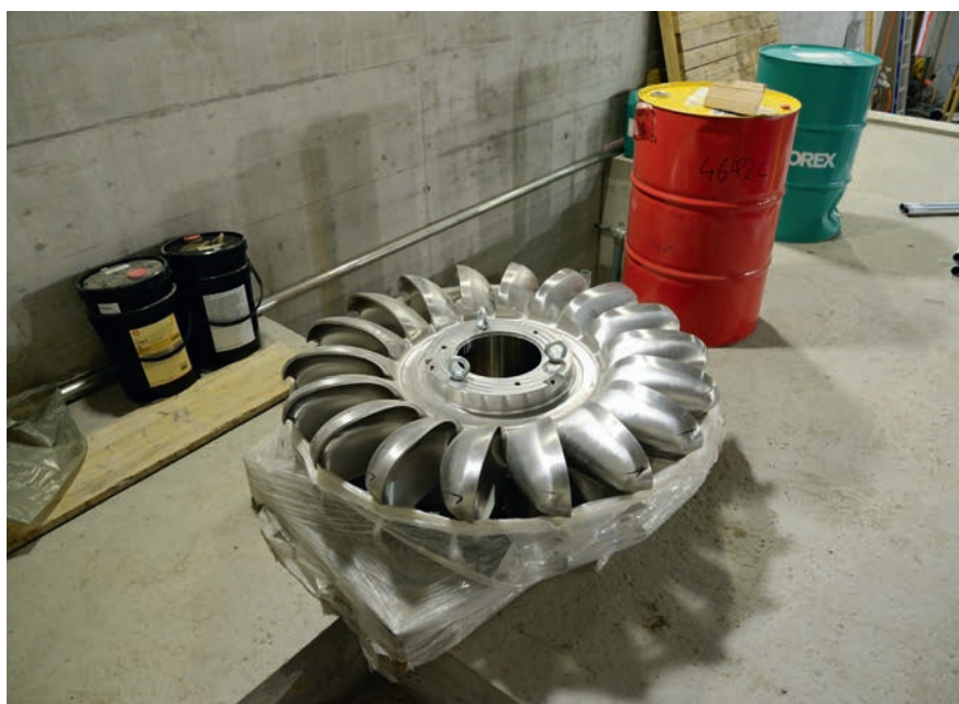
Auch ein Ersatz-Pelton-turbinenrad ist bereits vor Ort.