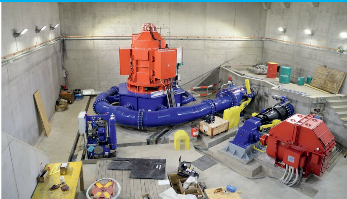
Maschinenhalle während den Installationsarbeiten: Pelton-Turbine (links) und Ossberger-Turbine. Die Wasserkomponenten sind blau, die Generatoren rot.