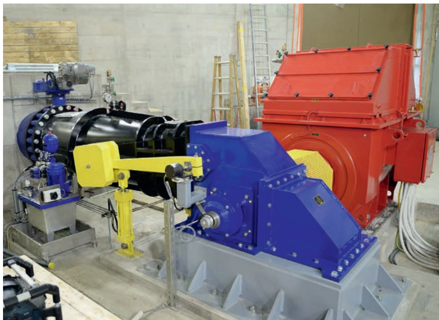
Ossberger-Durchströmturbine mit Generator.

Im Sommer, wenn genügend Wasser vorhanden ist, werden beide Turbinen gleichzeitig betrieben. Ein übergeordnetes Steuergerät (Joint Controller) analysiert den jeweiligen Wirkungsgrad der Turbinen und definiert, welche Turbine wie betrieben wird. Im