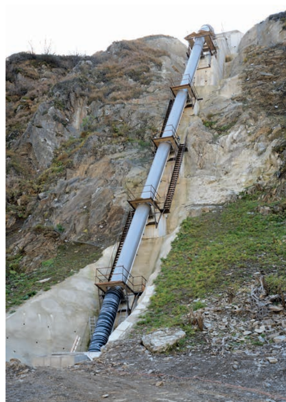
Druckleitung aus Stahl während der Bauphase. Die Treppen und Hilfskonstruktionen wurden anschliessend entfernt.

Die bei Realp II geplanten Baukosten von 17,5 Mio. Fr wurden übertroffen, da ungünstige geologische Verhältnisse, nicht geplante Hangsicherungen, Entwässerungsmassnahmen sowie eine nicht vorhergesehene Felsicherung im Bereich der Wasserfassung dazukamen. Ein Nachtragskredit wurde erfor-