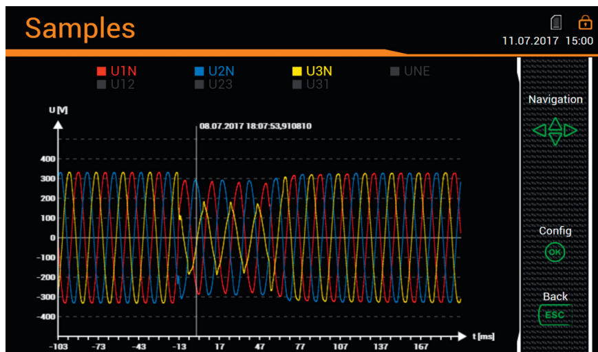
Bild 2 Spannungseinbruch (Samples) während eines Sommergewitters in der Haupteinspeisung eines Elektronikproduzenten.

(Frequenz- und Phasengang) der Strom- und Spannungswandler zu kennen, um aussagekräftige und verwertbare Messresultate zu erzielen. Zudem sind die sichere, korrekte elektrische Installation der Messwandler, der Messgeräte sowie die EMV-konforme Verdrahtung der Mess- und Kommunikationsleitungen eine Voraussetzung für den Messerfolg. Schliesslich muss durch eine auf anerkannte Normale rückführbare Prüfung oder Kalibrierung sichergestellt sein, dass Messergebnisse vergleichbar sind – mit anderen Messergebnissen und mit Anforderungen von Normen, Verträgen oder Gesetzen. Nur mit einer geeigneten Messkette können aus physikalischen Netz-Vorkommnissen relevante