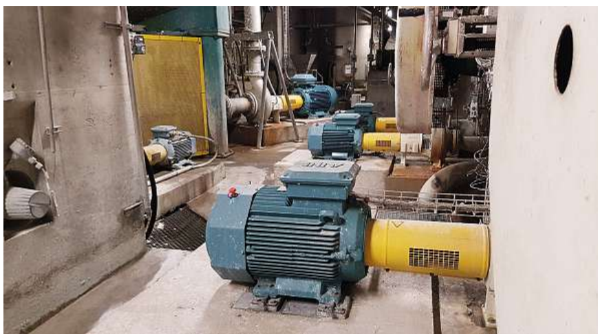
Kimberly-Clark senkte dank neuer Pumpen Kosten und Verbrauch um gut einen Drittel.

Druckaufbau und in geschlossenen Flüssigkeitskreisläufen eingesetzt – und sie sind am häufigsten in der Nahrungsmittelindustrie, in der chemischen und pharmazeutischen Industrie sowie in der Papierherstellung zu finden.