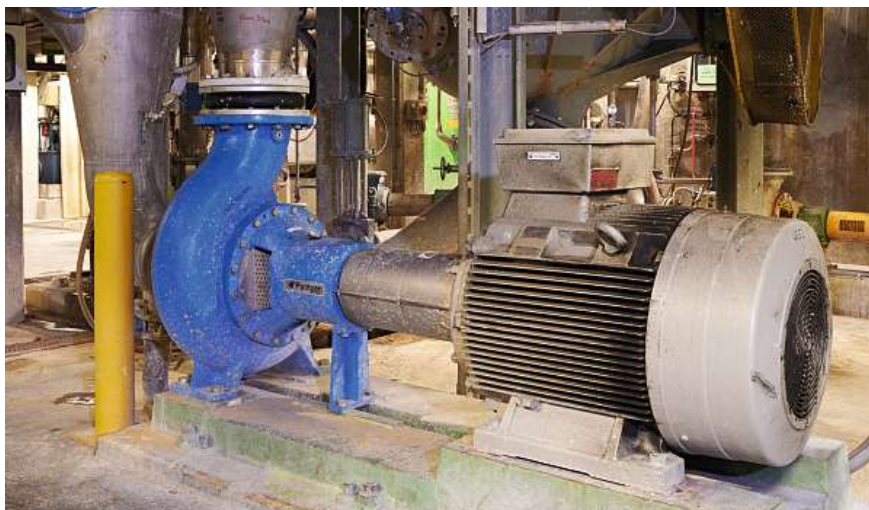
Die neue Pumpe bei Swiss Quality Paper in Balsthal braucht nur halb so viel Strom wie die alte.

Der Fokus von ProEPA liegt auf Trockenläuferpumpen. Diese werden primär beim Pumpen, Heben und Transportieren von Flüssigkeiten, beim