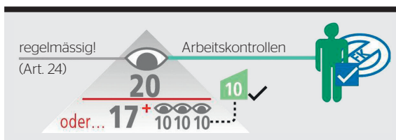
Bild 3 Bis 20 Personen genügt ein fachkundiger Leiter, aber er muss vollzeitlich beschäftigt sein.

eine verbesserte Sicherheit der Installationsarbeiten und schliesslich der elektrischen Anlagen.