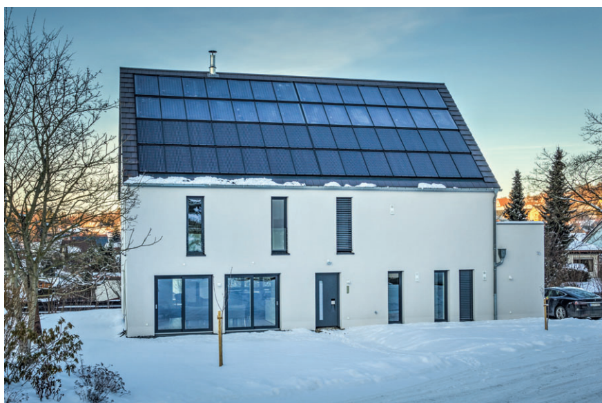
Bild 2 Eines der neun Solaraktivhäuser plus in Deutschland, die bei einem Monitoring berücksichtigt wurden.

aktivhäuser einerseits zuverlässig funktionieren und damit einen wichtigen Beitrag zur Einhaltung der Klimaschutzziele leisten. Andererseits wurde jedoch auch klar, dass der Nutzer sowie die mehr oder weniger konsequente Ausnutzung der winterlichen Einstrahlung die Effizienz des Gesamtsystems massgeblich beeinflussen können. Weiter kann der grosse, im