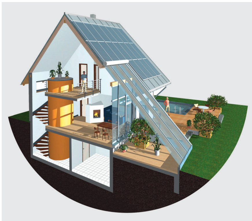
Bild 1 Mit grossen Fensterflächen in Richtung Süden wird die Sonnenenergie sinnvoll genutzt.

In einem vom deutschen Ministerium für Wirtschaft und Energie geförderten Vorhaben wurde ein umfangreiches Monitoring von neun über ganz Deutschland verteilten Solaraktivhäusern durchgeführt. Das Forschungsprojekt zeigte, dass die sowohl als Einfamilienhäuser wie auch als Mehrfamilienhäuser realisierten Solar-