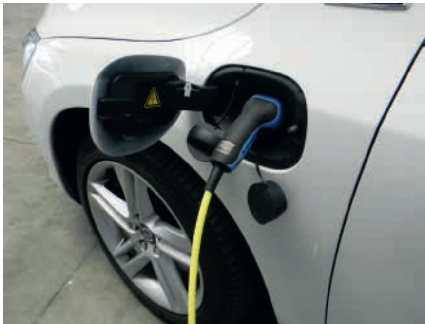
Die Vorschläge der Europäischen Kommission sehen ab 2025 auch zwingend Ladestationen für Elektroautos in Neu- und Umbauten ohne Wohnzweck vor.

Das Europäische Parlament hatte im vergangenen Jahr in einem unverbind-