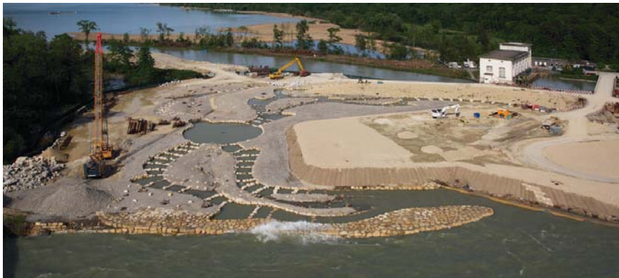
Figure 4 Une grande surface a été octroyée pour favoriser la mobilité des poissons. L'ancienne centrale se trouve à l'arrière-plan.

surtension et dispositifs de protection. Le transfert de l'énergie est assuré par des câbles au-dessus du nouveau pont vers la nouvelle sous-station de Hagneck.