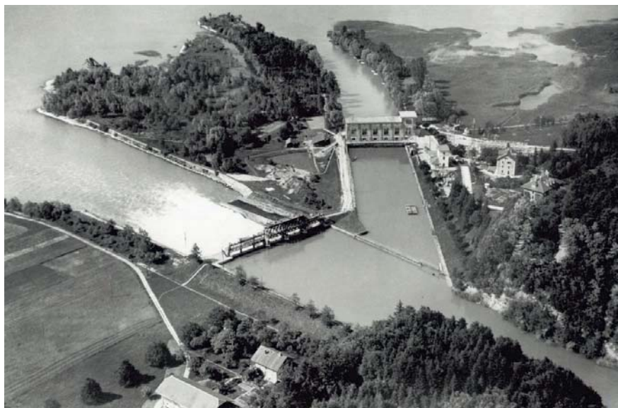
Figure 2 La centrale hydroélectrique de Hagneck aux alentours de 1920.