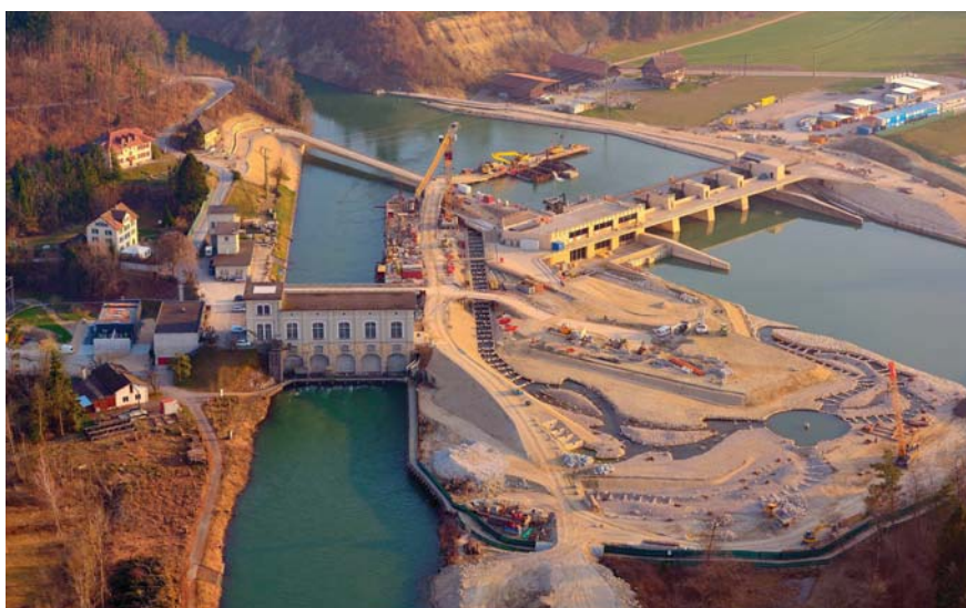
Figure 1 Construction de la nouvelle centrale hydroélectrique et de son impressionnant canal de dérivation pour les poissons (au premier plan).

La division BKW Engineering s'est chargée de la planification de la nouvelle centrale hydroélectrique. Elle compte une centaine de spécialistes et couvre les domaines de la construction hydraulique, des ouvrages en béton, des techniques de commande, de la construction hydraulique en acier (vannes, grilles, batardeaux), de l'architecture, ainsi que de l'électromécanique. Les spécialistes de BKW ont fourni les prestations suivantes :