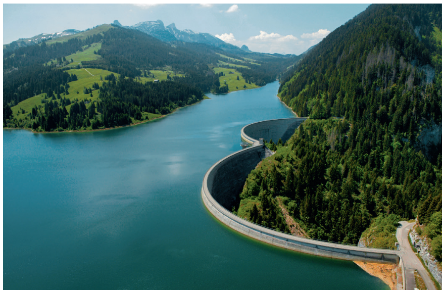
Bild 3 Der Hongrin-Stausee des Waadtländer Pumpspeicherkraftwerks FMHL. Am Kraftwerk wird das Potenzial des Hydraulischen-Kurzschlussbetriebs zur Bereitstellung von stufenloser negativer Regelleistung erforscht.