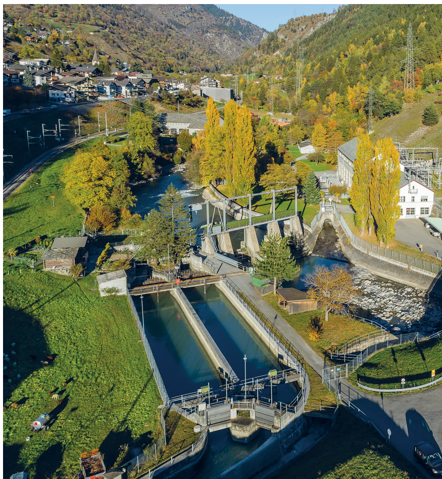
Bild 4 Im Hochdruck-Laufwasserkraftwerk Ernen im Oberwallis wird der Ersatz der bisherigen Francis-Turbine durch eine Pelton-turbine erprobt, um Erfahrungen für Retrofit-Massnahmen zu gewinnen.

führen. Die Instabilitäten rühren von Wirbeln, die nach dem Durchströmen der Turbine entstehen und zu Blasenbildung (Kavitation) führen.