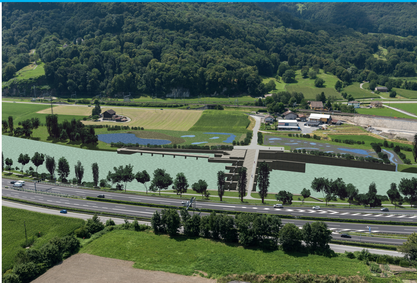
Visualisierung des neuen Flusskraftwerks in Masingen im Unterwallis.