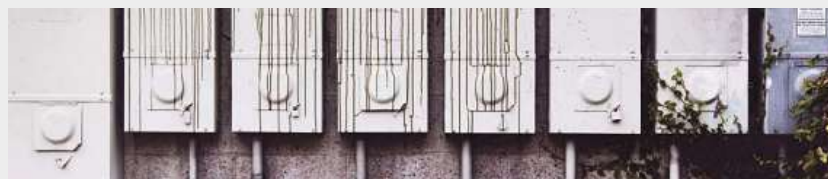
Bild 2 Definition und Elemente eines Smart Grid.

Verbraucher und Produzenten: Die Verbraucher und Produzenten sind im Smart Grid eingebunden, kommunizieren über ICT und können Befehle entgegennehmen sowie verarbeiten.