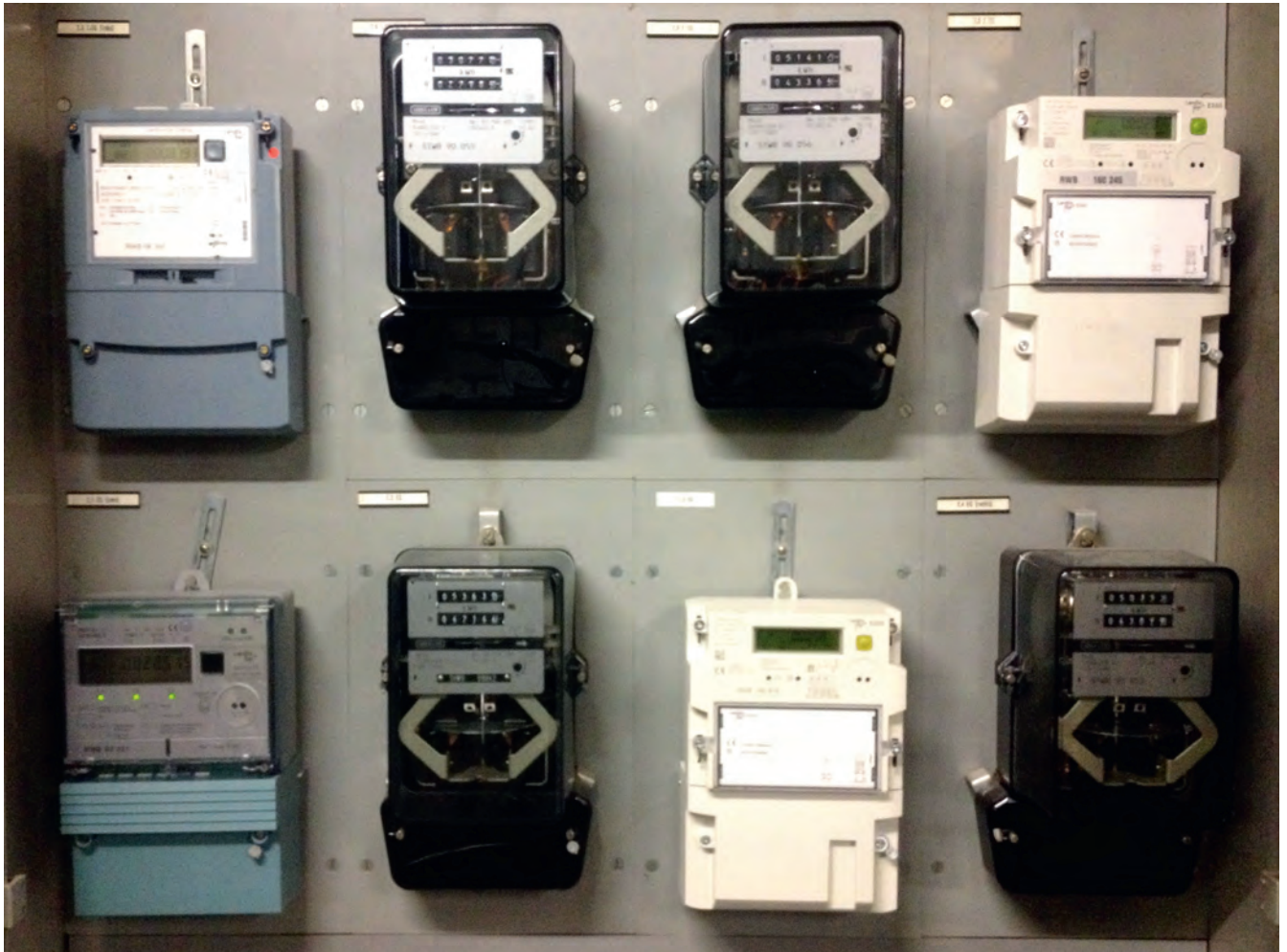
Armoire à compteurs d'un regroupement de consommation propre.