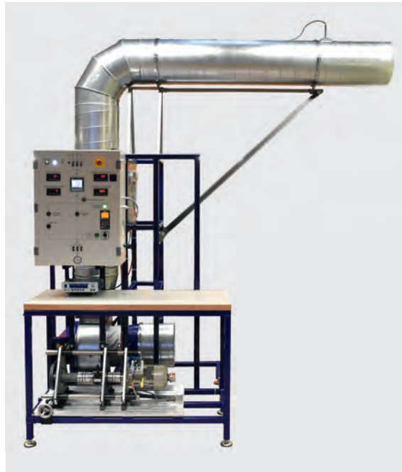
Figure 1 Banc d'essai développé pour l'analyse énergétique de différentes configurations de systèmes de ventilation.

Dans le but d'analyser l'effet de la transmission mécanique, le banc d'essai permet de changer la courroie