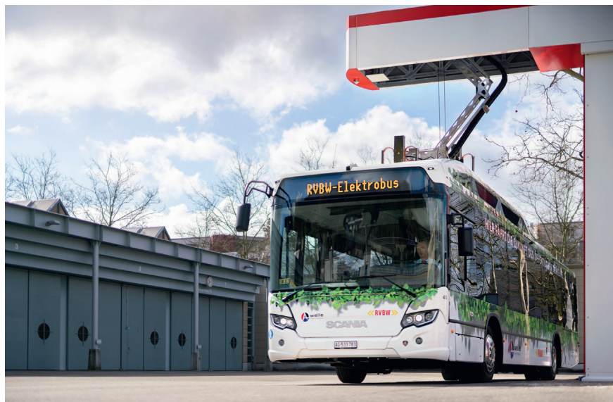
Auch für die zukünftige Ausbaustrategie gut positioniert: Die erste Ladestation der RVBW vor dem Depot in Wettingen.

Die All-In-One-Ladestation von Furrer+Frei AG zeichnet sich durch ihre einfache Konzeption aus: Alle Komponenten sind in der Ladestation integriert. Dadurch ergeben sich Kostenvorteile im Bau und im Betrieb sowie eine einfachere architektonische Integra-