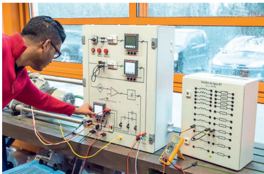
Dans les domaines énergétiques, les travaux pratiques de laboratoire constituent l'un des éléments fondamentaux de l'enseignement.

possible de demander à un ingénieur électricien de devenir simultanément chimiste et thermodynamicien lorsqu'il devra intégrer des batteries ou un stockage à air comprimé dans un réseau; néanmoins, il devra être en mesure de comprendre les éléments les plus importants et les limitations des systèmes non électriques qu'il est censé intégrer, et ce, de manière plus que « superficielle ». Il va sans dire que ces « mariages » vont se multiplier dans les systèmes énergétiques du futur: batteries, réseaux électriques, gaz naturel, hydrogène, chauffages à distance, unités de cogénération, piles à combustible, stockages hydropneumatiques, etc.