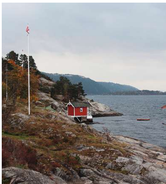
Figure 4 Comme la Suisse, la Norvège est un pays de lacs et de montagnes.

nomiques est désigné comme une imposition du surplus des revenus, c'est-à-dire des revenus bruts moins les coûts de production, les montants d'imposition et les investissements. Il se chiffre à 37% pour des installations de plus de 10 MW. La vente obligatoire d'électricité aux communes productrices d'énergie hydraulique s'applique jusqu'à 10% de la capacité théorique de production des installations. L'électricité doit être vendue aux communes au coût de production. Si les communes n'utilisent qu'une partie de cette énergie, elles ont le droit de la revendre à la fylke (région) dans laquelle elles se trouvent. Les redevances de concession, finalement, sont basées sur la