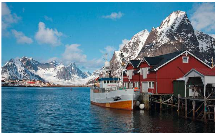
Figure 3 L'électrification du vaste secteur naval est imminente en Norvège.