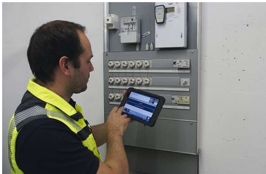
Bild 3 Ablesung des neuen Zählers via Bluetooth nach der Montage.

Unterstützung bei diesem Vorhaben bietet die EcoWatt AG, eine Tochterfirma der SAK. Sie bietet Messdienst-