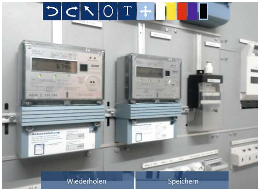
Bild 5 Bilddokumentation der Vorort-Installation.

Software zur Zählerparametrierung auf dem gleichen Betriebssystem ausgeführt wird, kann sie mit auf dem Tablet installiert werden. So hat der Servicetechniker alle Informationen zur Anlage gleich zur Hand. Er hat Zugriff auf alle für den Austausch relevanten Informationen wie Name, Adresse und