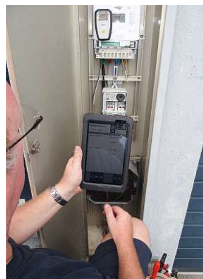
Bild 4 Parametrierung der Relais.

Über die Synchronisation des Tablets mit dem zentralen Server werden die Daten wieder dem Abrechnungssystem übergeben. Weitere Änderungen der Stammdaten wie Lagerbewegung oder Preismodelländerung beim Kunden erfolgen automatisch. Auch die Instal-