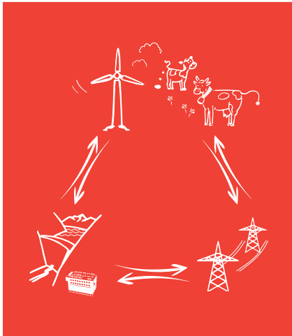
Bild 2 Das Dreieck Produktion-Transport-Speicherung.