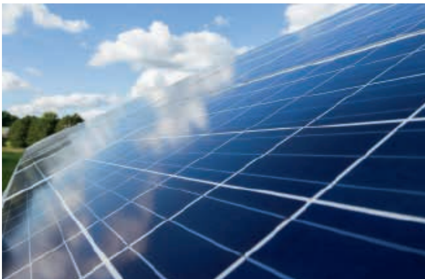
Der Betreiber von drei Photovoltaikanlagen brachte diesen Stein ins Rollen.

werden muss und Quersubventionierungen zwischen dem Netzbetrieb und anderen Tätigkeitsbereichen zu unterbleiben haben. In Art. 10 Abs. 2 und Abs. 3 StromVG werden dann die konkreten Massnahmen zur Verhinderung der Quersubventionierung umschrieben, die einerseits aus dem Verbot der Weitergabe und Nutzung von wirtschaftlich sensiblen Informationen in andere Tätigkeitsbereiche und andererseits aus der buchhalterischen Entflechtung des Verteilnetzbereichs von den übrigen Tätigkeitsbereichen bestehen.