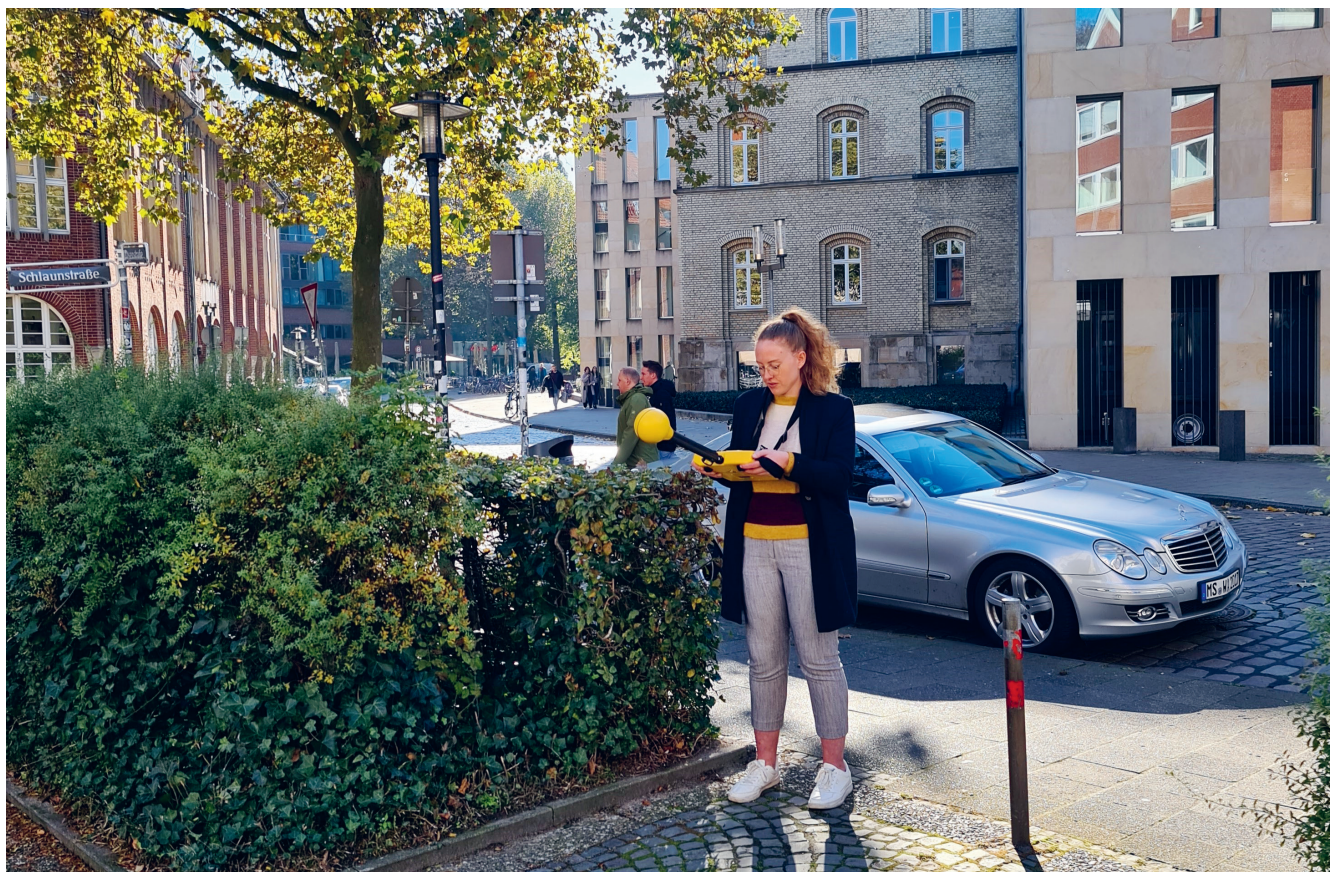
Messung mit portablem Spektrumanalysator und isotroper Messsonde.