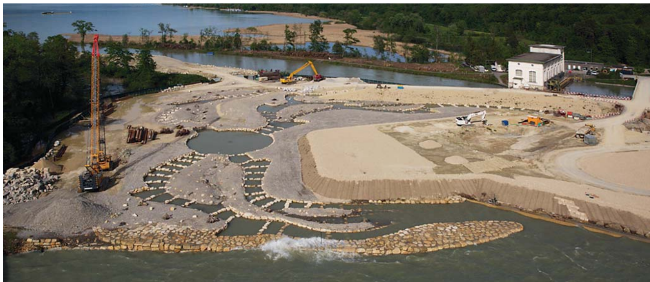
Bild 4 Viel Raum wurde der Fischgängigkeit eingeräumt. Hinten sieht man das alte Kraftwerk.