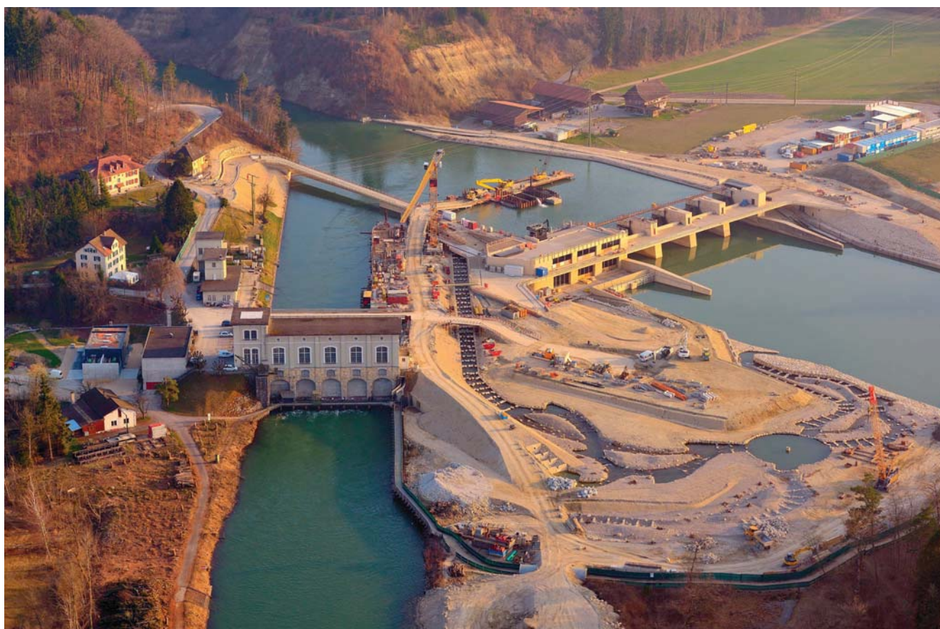
Bild 1 Bau des neuen Wasserkraftwerks (rechts) mit markantem Fischumgehungsgerinne (vorne).

Das Werk erfüllt damit nicht nur hohe ökologische Anforderungen, es fügt sich auch architektonisch schön in diese schützenswerte Landschaft ein. Da auf