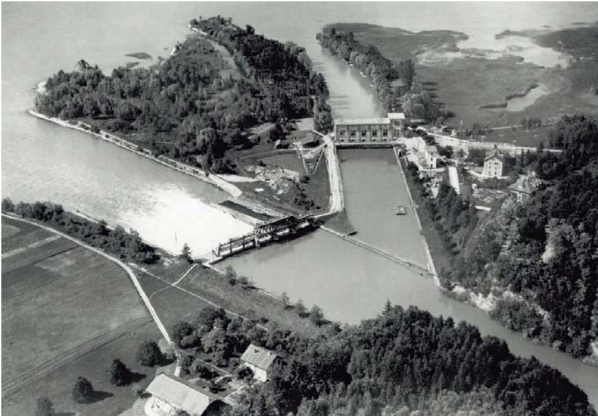
Bild 2 Das Wasserkraftwerk Hagneck um 1920.