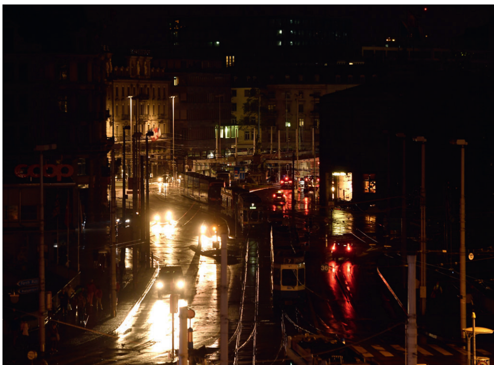
In der Schweiz ist noch kein Stromausfall bekannt, der durch Cyberattacken verursacht wurde. Am 4. und 5. September 2016 fiel der Strom in Zürich wegen einem defekten Hochspannungsisolator aus.