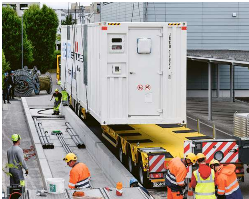
Lieferung der beiden Batteriespeicher-Container auf den Werkhof in Jona.

Aufgrund des knappen Terminplans begannen bereits am Tag nach dem Ablad die Aussenmontage der Lüftungsgehäuse und die Kabelverbindungen für die Eigenbedarfsversorgung (AC) des Batterie-Containers. Axpo