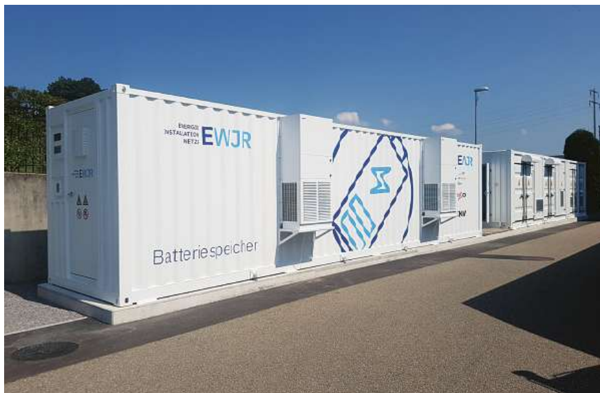
Nach der Installation wurde der Batteriespeicher für die Elektrizitätswerk Jona-Rapperswil AG in Betrieb genommen.